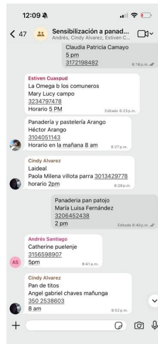
Ilustraciones 1 y 2.

Grupo de WhatsApp realizado para la sensibilización de potenciales panaderías.